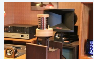
組み合わせ例(ウッドボードスピーカー-HIT-FP1)