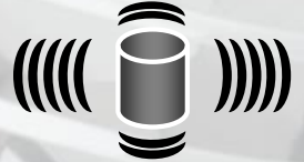
従来のスピーカーの音の波形特性 波形を広げながら、減衰しつつ進む