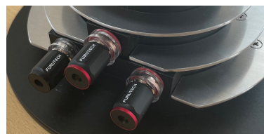
内蔵ネットワークのHi/Lo切り替え端子